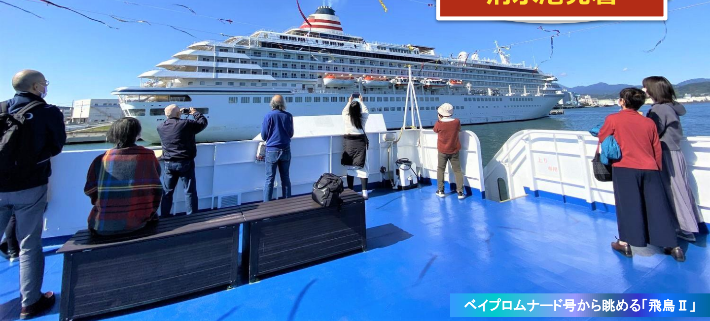
ベイプロムナード号から眺める「飛鳥Ⅱ」